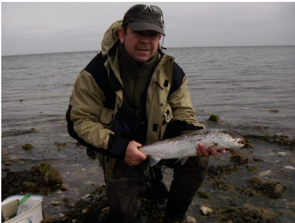
Auch Stefan hat Erfolg