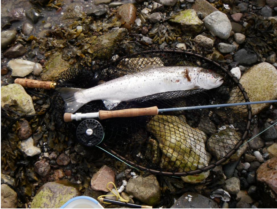
Dafür sind wir hier