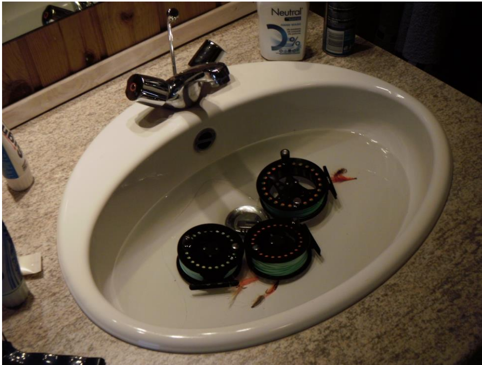
Entspannungsbad für Rollen und Fliegen