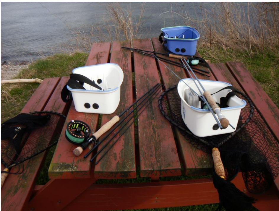
Equipment macht Pause