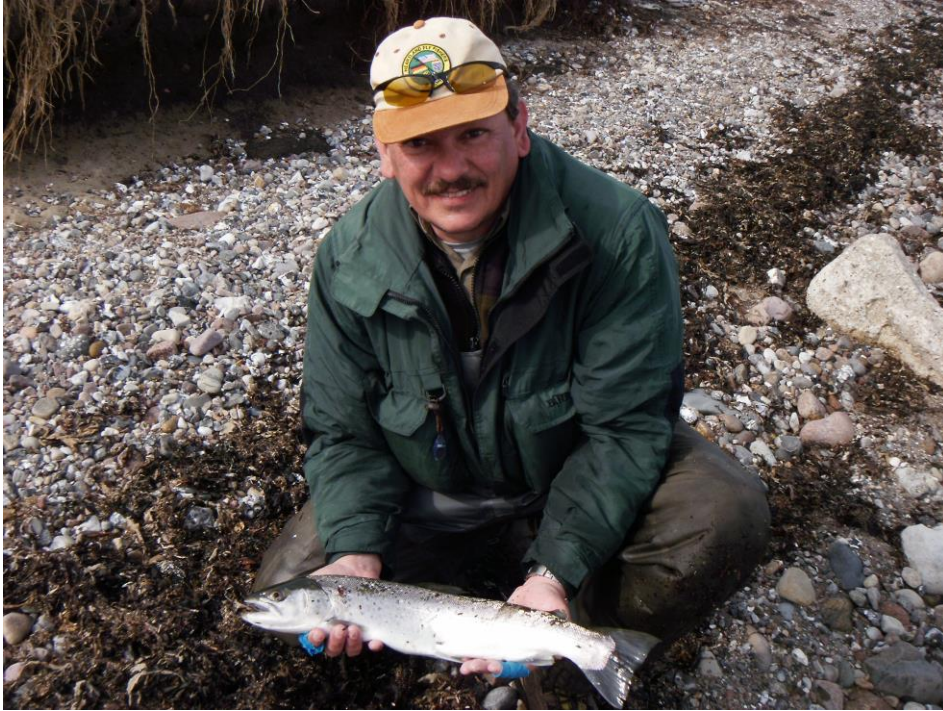
Auch ich habe eine