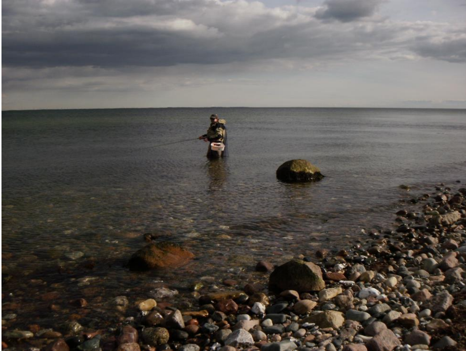
Nahe am Ufer ziehen die Fische