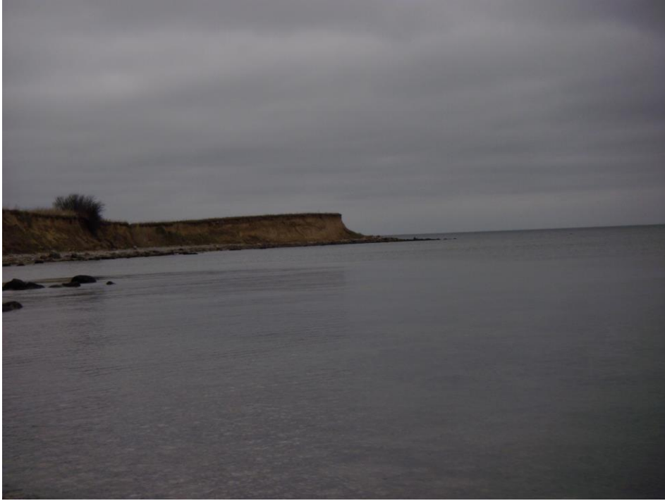
Landspitze mit Steilküste